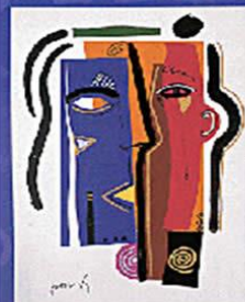
Respeto a la persona

Consideramos a cada una de las personas como individuos dignos de atención, con intereses más allá de lo estrictamente profesional o laboral.